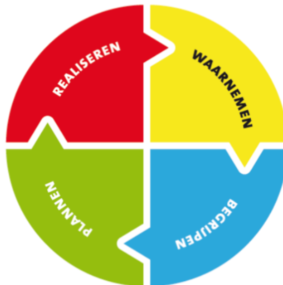
Figuur 1. HGW-model